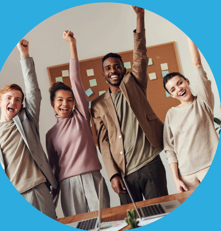
TABLE DE CONVERSATION